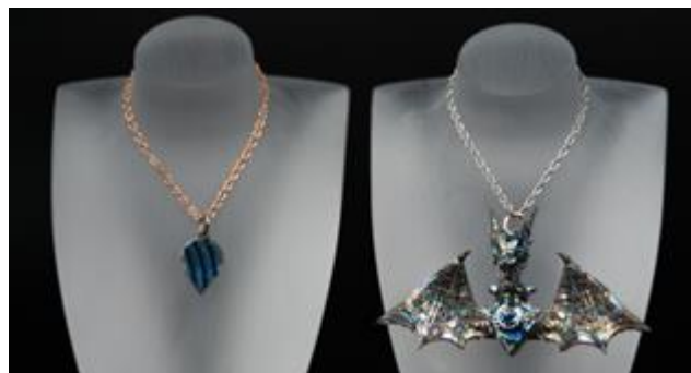
魅惑的な光を放つ壊れかけのメカ ドラゴン 株式会社 キヤステム