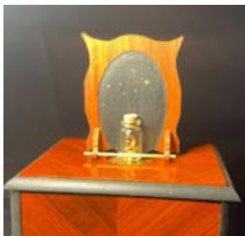
自鳴瓶(じめいびん)～Wish Upon A Star～ Jazz Ver. 東京工業大学/連携企業:株式会社狭山金型製作所