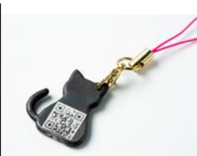
「ものづくりの基礎が学べる」猫の キーホルダー 大分工業高等専門学校(大分高専)